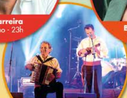
José Praia e Aqua Viva 10 de julho - 20h