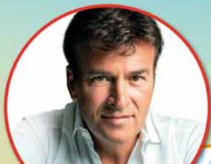
Tony Carreira 8 de julho - 23h

De 8 a 10 de julho de 2022 MARINA DE ALBUFEIRA