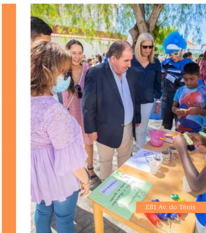
EB1 Av. do Ténis