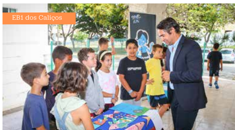
EB1 dos Calções