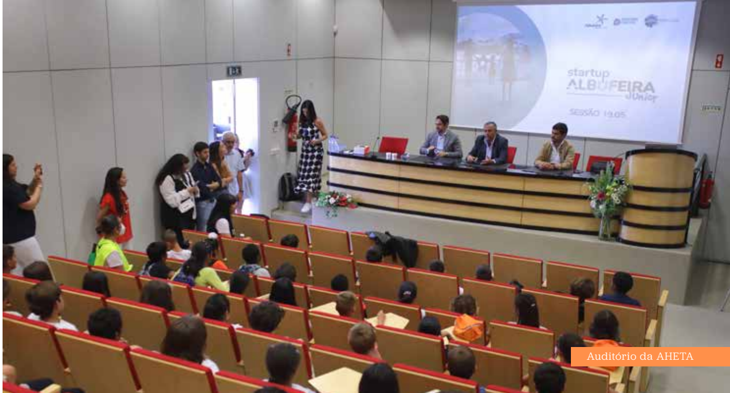
Audatório da AHETA