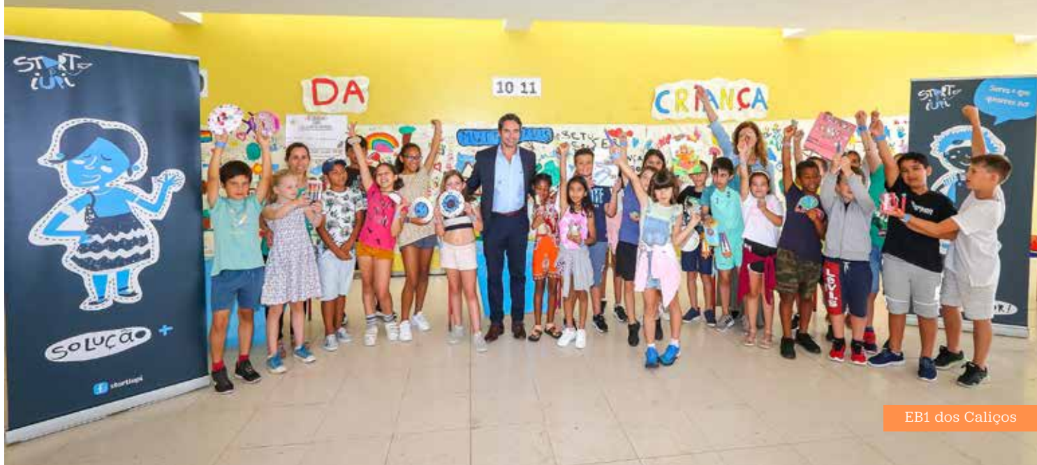
EB1 dos Calções