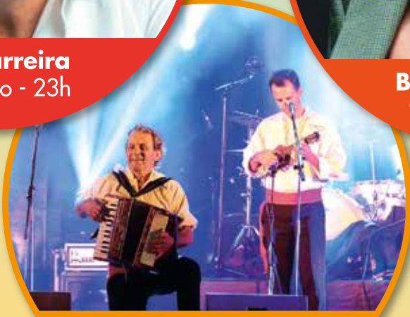
José Praia e Aqua Viva 10 de julho - 20h