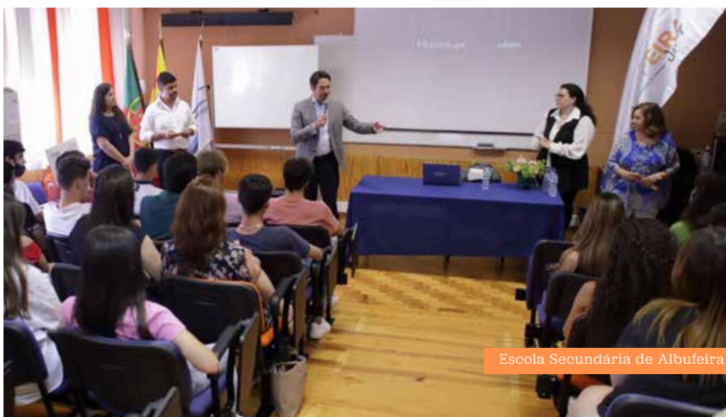
Escola Secundária de Albufeira

O projeto foi composto por três sessões, onde os mais pequenos desenvolveram e potenciaram as suas competências empreendedoras e experienciaram o ciclo de criação de valor do produto. Assim, para além da apreensão dos conceitos, pretendeu-se que fossem criados pequenos produtos que possam ser simbolicamente comercializados nas Feiras Startiupi, que aconteceram a 8 de junho, em cada Agrupamento de Escolas de Albufeira.