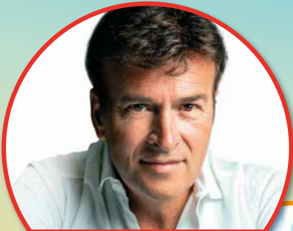
Tony Carreira 8 de julho - 23h

De 8 a 10 de julho de 2022 MARINA DE ALBUFEIRA