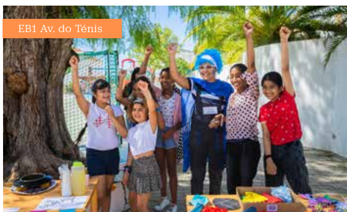
EB1 Av. do Ténis